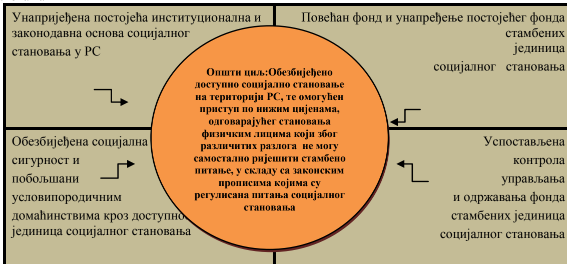
Анализа Радне групе

Мјере за спровођење циља: Обезбјеђење социјалне сигурности и побољшање животних услова кроз доступност стамбених јединица социјалног становања; Повећање доступности субвенционисања за трошкове становања