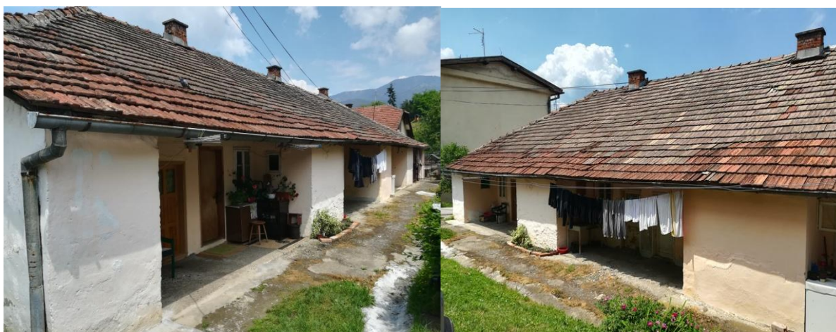
Улица 12. Јули, барака социјалног становања