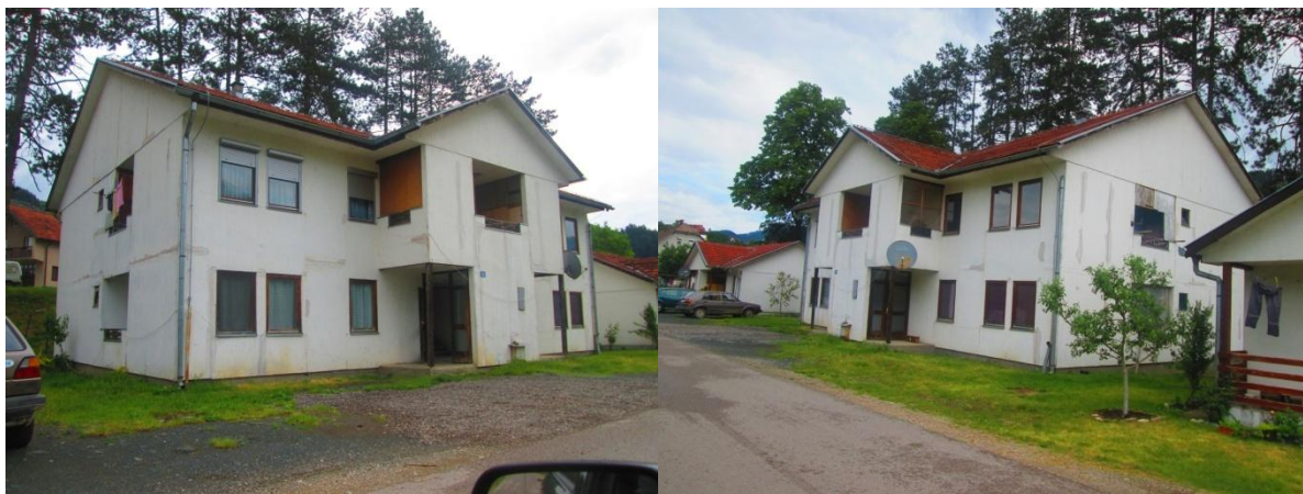
Стамбена зграда социјалног становања у Гојави