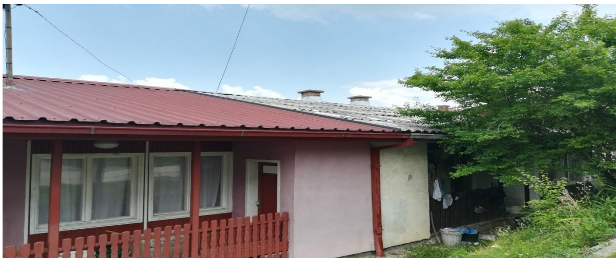
Улица Палих Српских бораца, барака социјалног становања