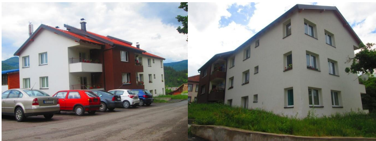
Стамбена зграда социјалног становања у улици Краља Петра I Ослободиоца

Поред наведеног броја стамбених јединица у насељу Гојава налази се 8 станова од чега су 4 стана у власништву општине Рудо, 4 стана користи Републички секретаријат за расељена лица и миграције за смјештај својих корисника (не располажемо информацијама да ли ће ови станови у складу са Законом о приватизацији државних станова ићи у откуп).